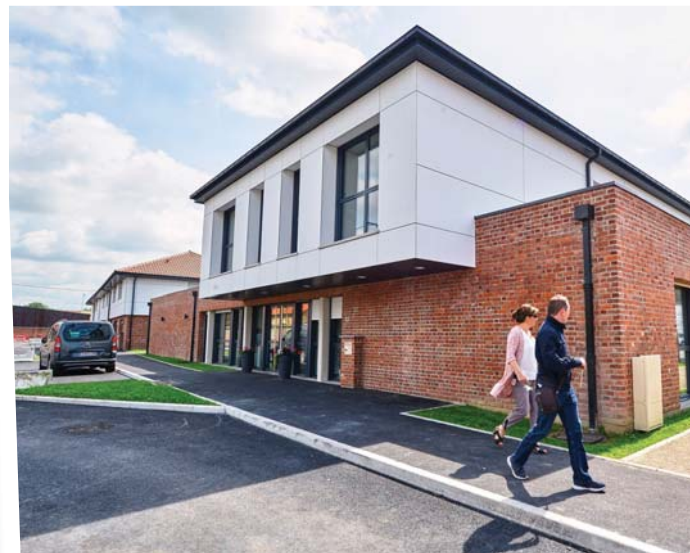
Maison Flamande : logements finalisés (photos ci-dessus et ci-dessous)