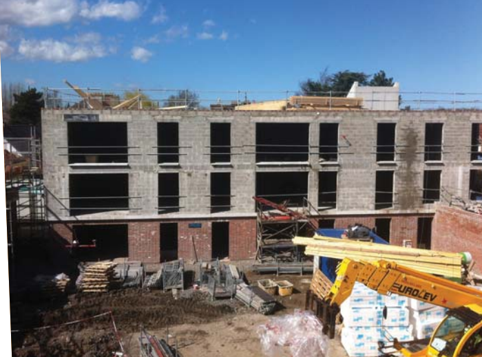
Maison Flamande : travaux de construction des 66 logements