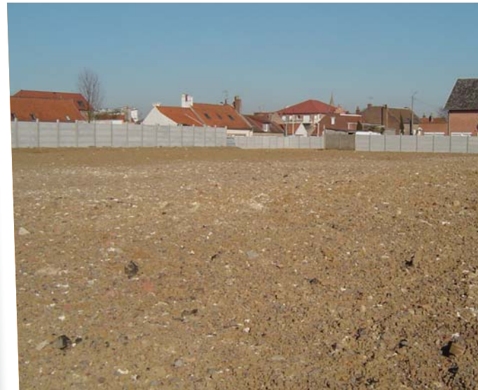
Mars 2010 : vue du site, du même point de vue, à l'issue des travaux menés par l'EPF