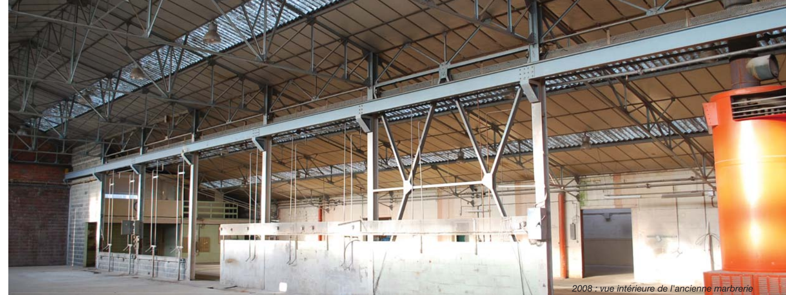
2008 : vue intérieure de l'ancienne marbrerie