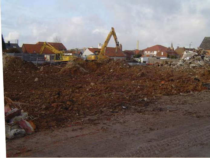
Décembre 2009 : vue du site durant les travaux de requalification