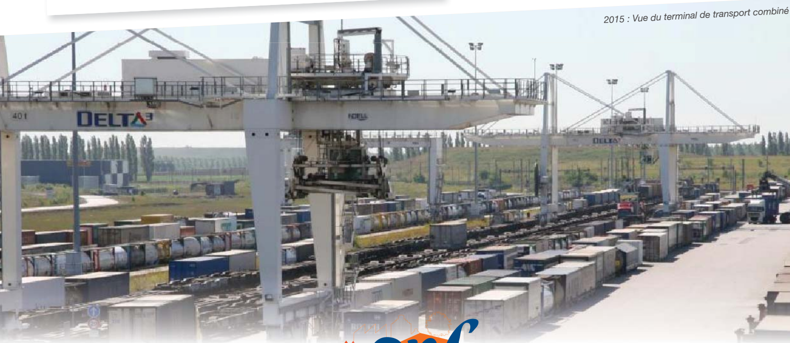
2015 : Vue du terminal de transport combiné