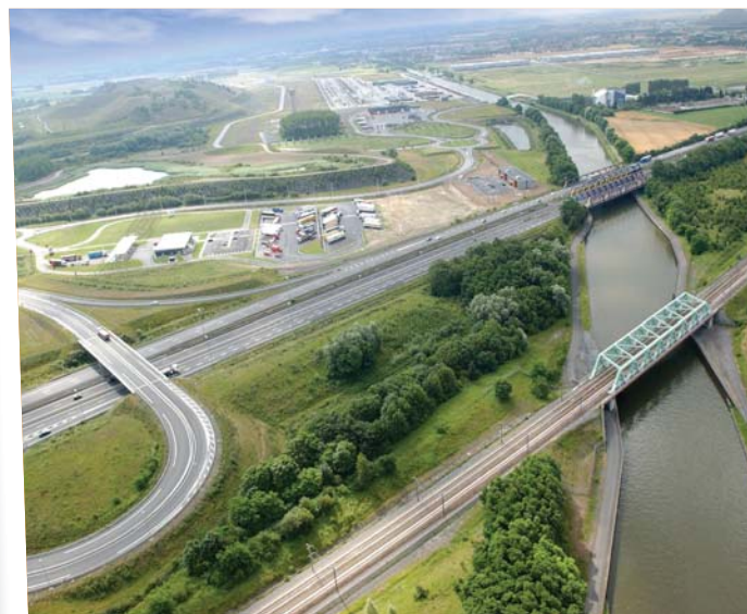
2006 : Après travaux et aménagement : vue aérienne de l'échangeur