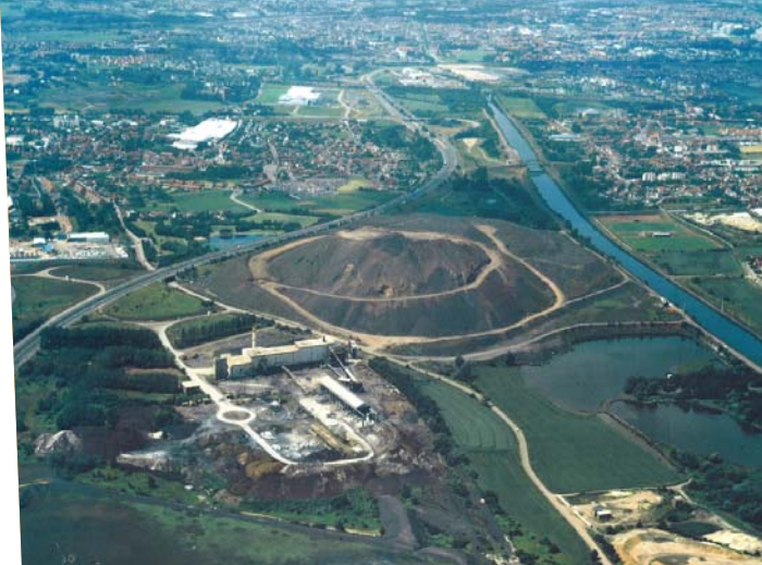
2003 : Vue aérienne du site de la future plate-forme