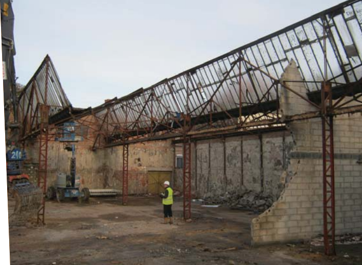
Octobre 2012 : ancien magasin en cours de démolition