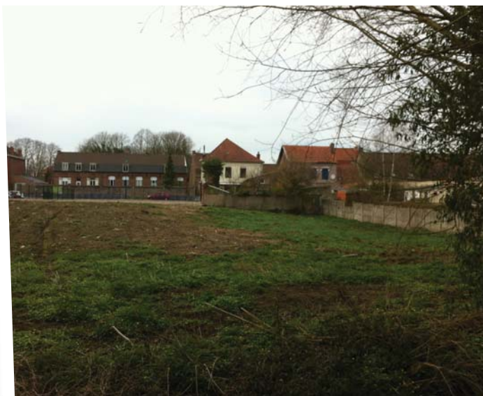
Décembre 2012 : à l'issue des travaux, le foncier recyclé par l'EPF - vue du fond de la parcelle