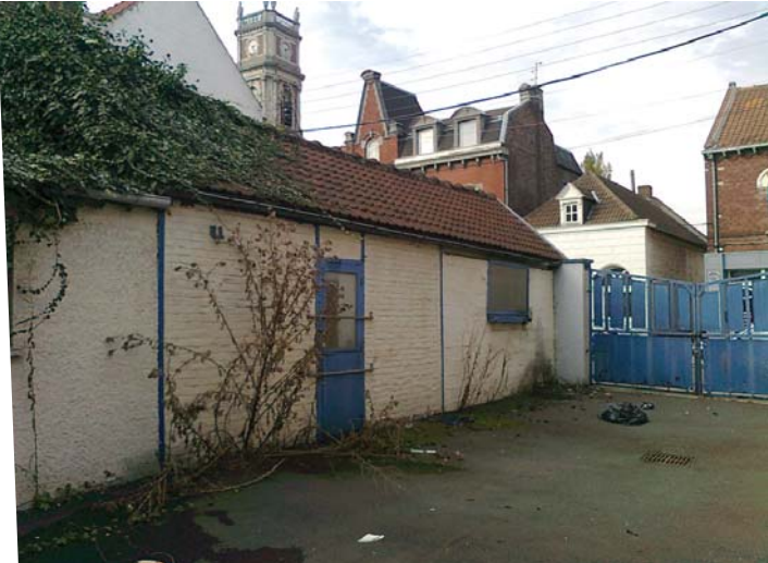
Décembre 2010 : une partie du site acquis et géré par l'EPF