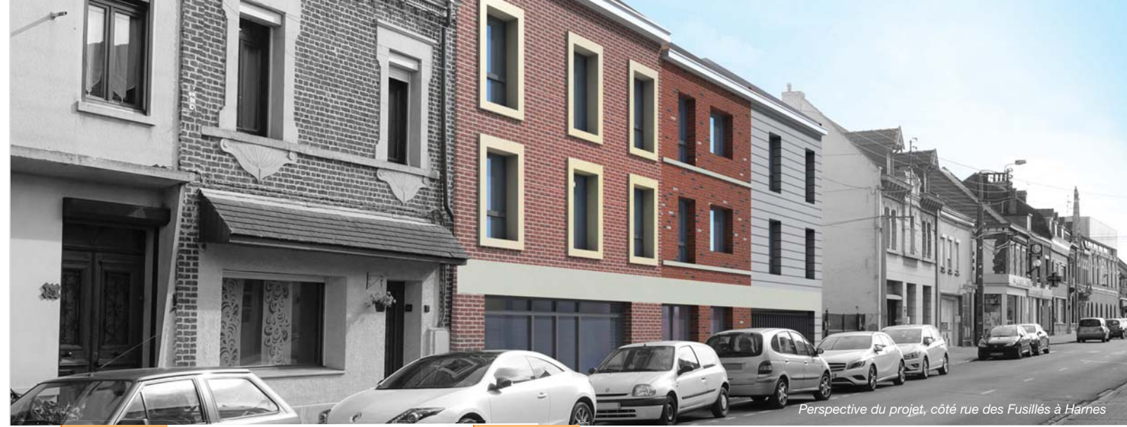
Perspective du projet, côté rue des Fusillés à Harnes