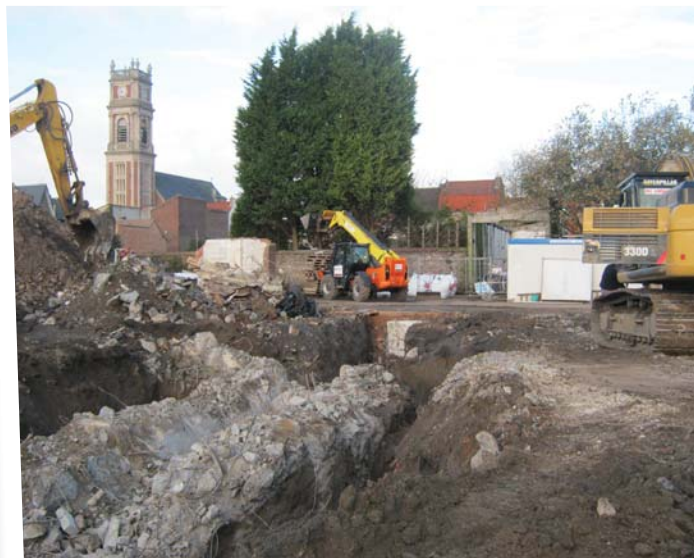
Nov. 2012 : même point de vue du site durant les travaux menés par l'EPF