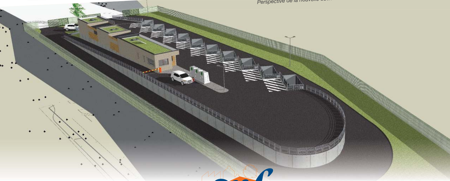
Perspective de la nouvelle déchetterie de Laventie - Début des travaux : juin 2016