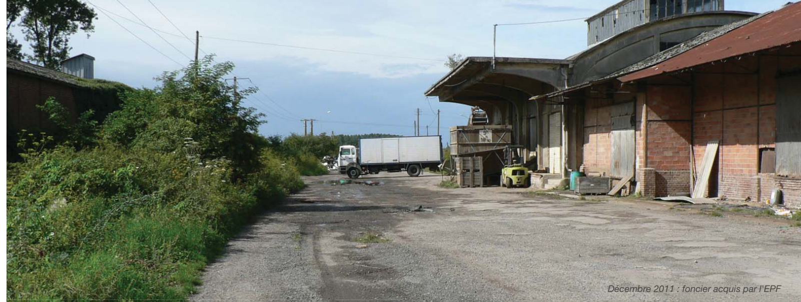
Décembre 2011 : foncier acquis par l'EPF