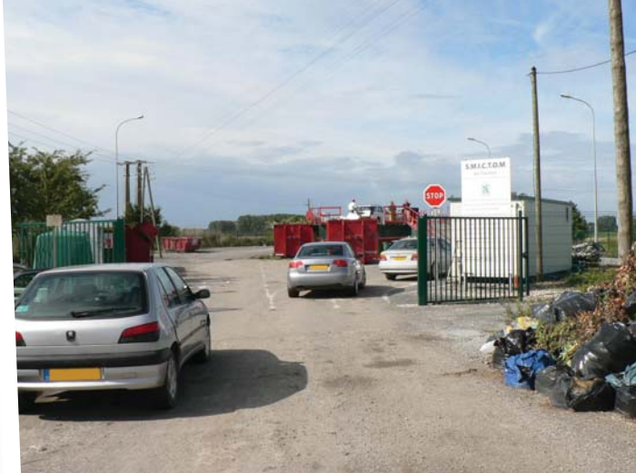
2013 : ancienne déchetterie