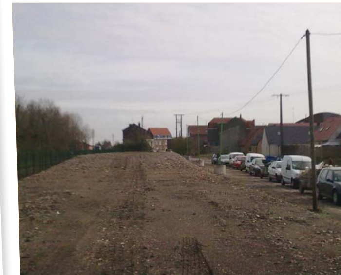
Avril 2013 : vue du site à l'issue des travaux menés par l'EPF