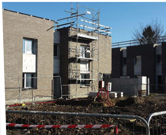
Pierres et Territoires de France : en 2015, construction des logements.