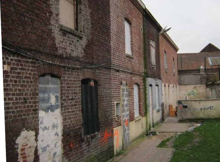
EPF Nord-Pas de Calais : en 2010, les habitats dégradés.