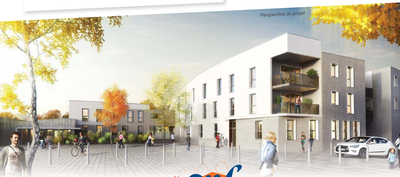
Perspective du projet