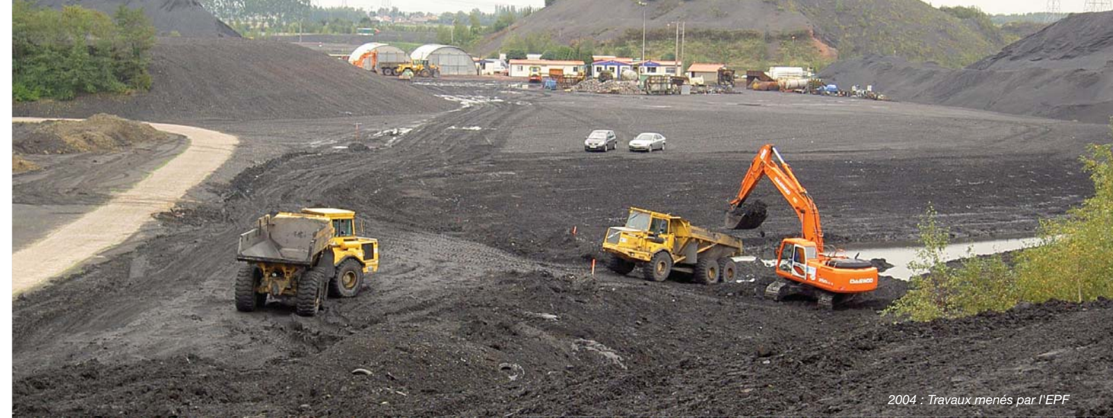
2004 : Travaux menés par l'EPF