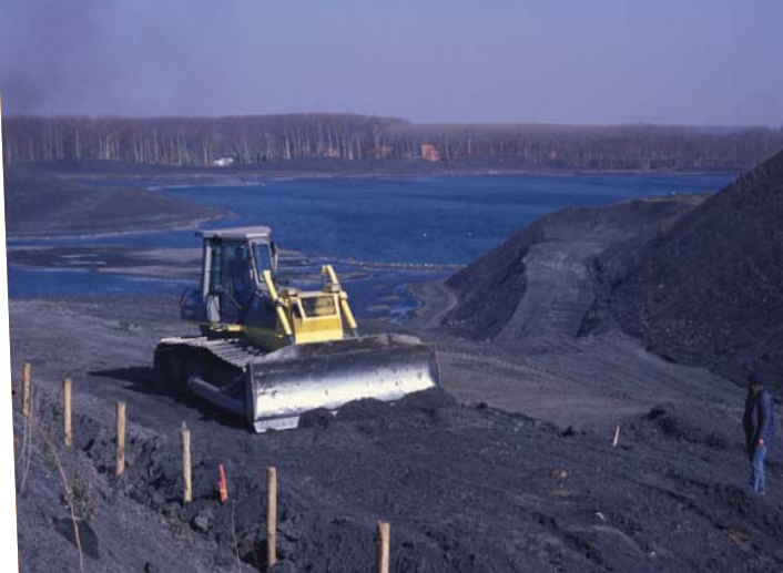
2004 : Travaux menés par l'EPF