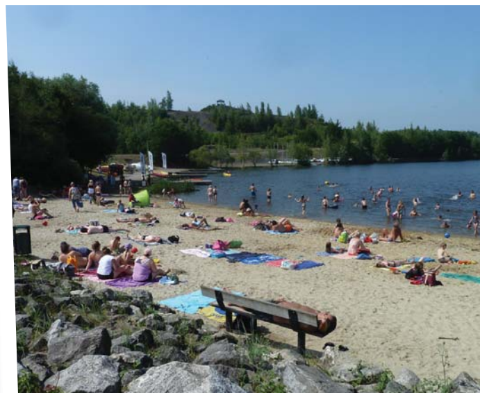
Ci-dessus et ci-dessous, le site après requalification