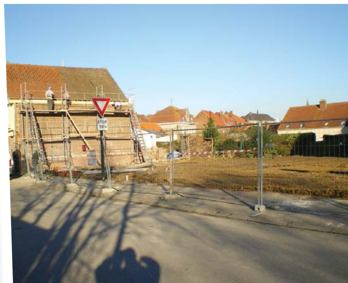
Novembre 2007 : rue de la gare, vue du même site après travaux