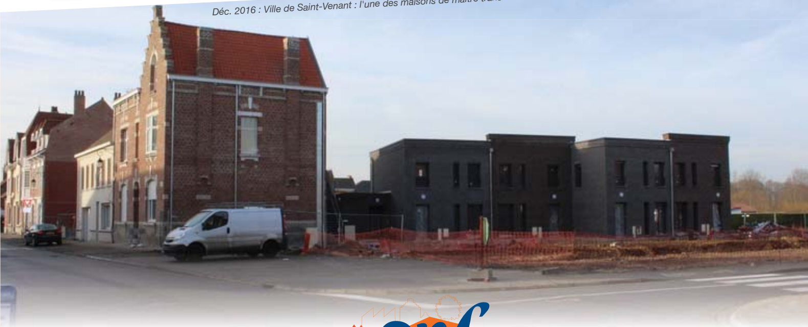
Déc. 2016 : Ville de Saint-Venant : l'une des maisons de maître transformée en logements étudiants et construction de nouveaux logements

Améliorer le cadre de vie et contribuer au développement de l'offre résidentielle