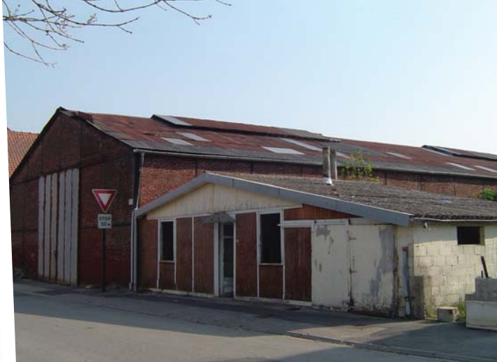
Avril 2007 : rue de la gare, avant travaux